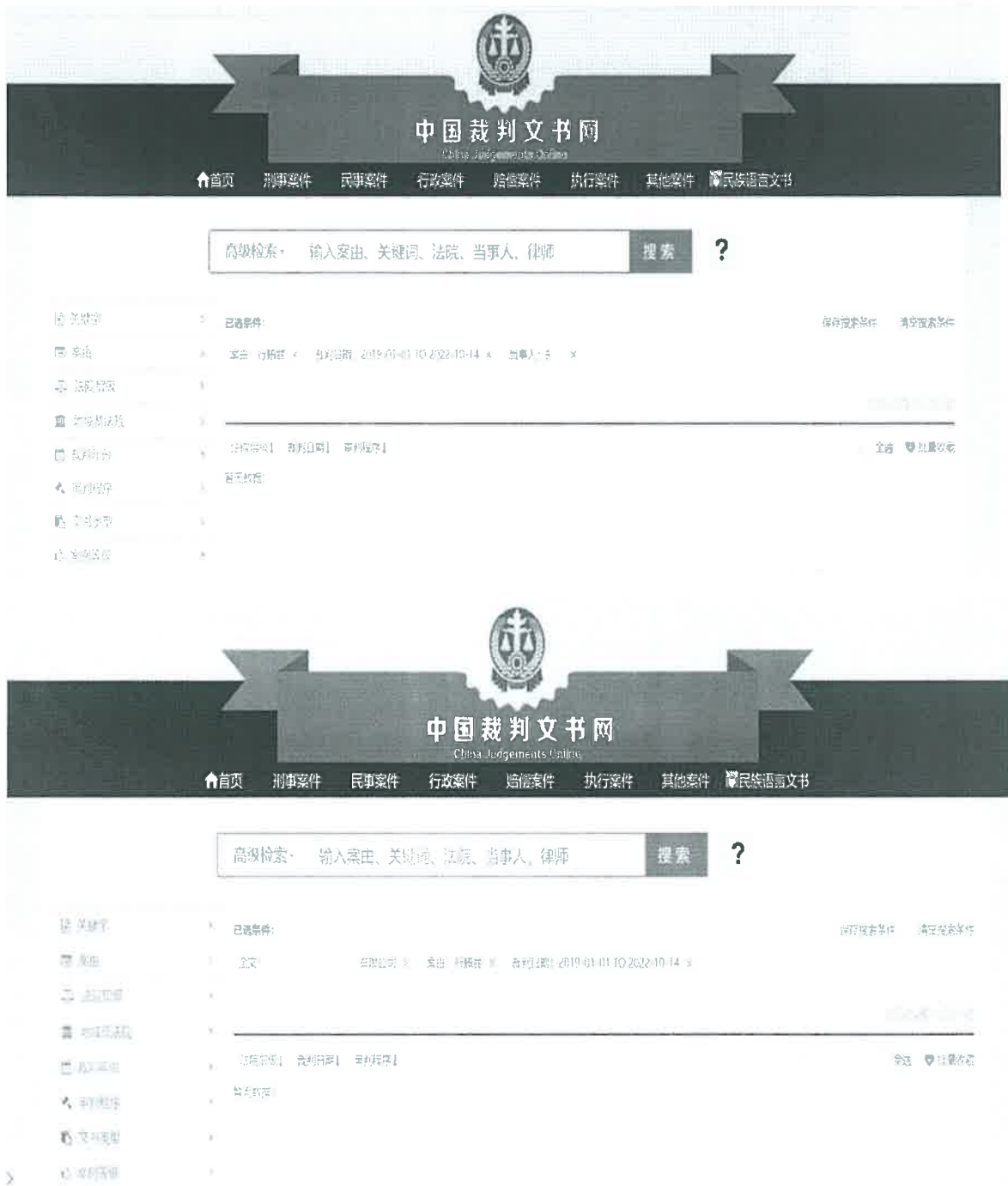
图例 4：中国裁判文书