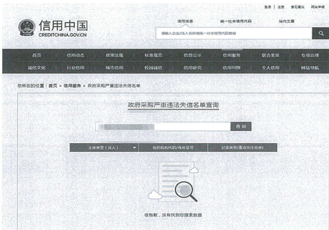
信用中国网政府采购严重违法失信行为记录名单截图