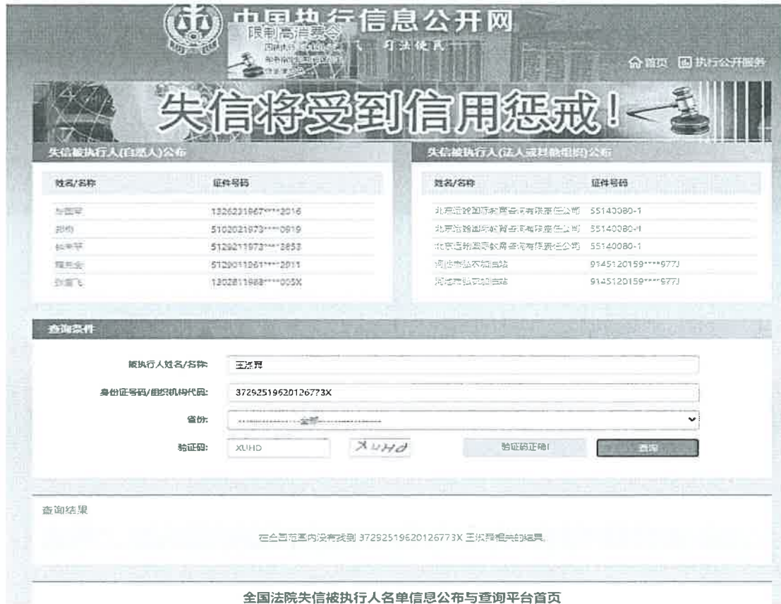
图示 3：中国执行信息公开网