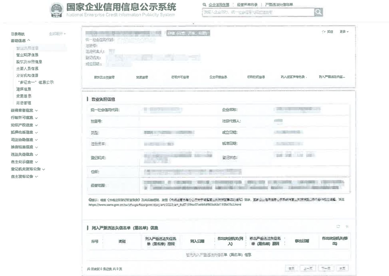
图示 5：国家企业信用信息公示系统