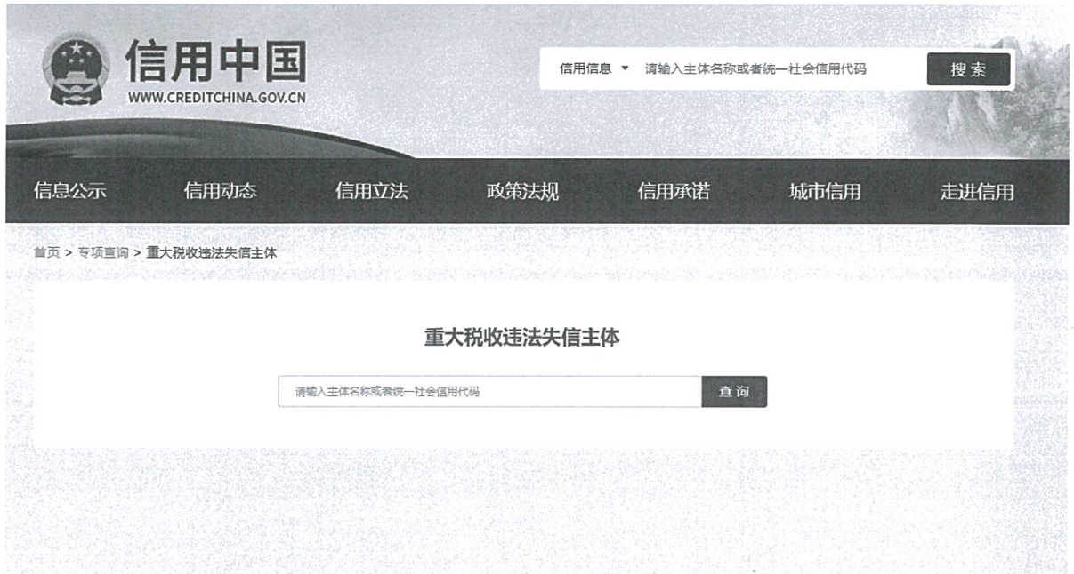
信用中国网严重失信主体名单查询记录截图