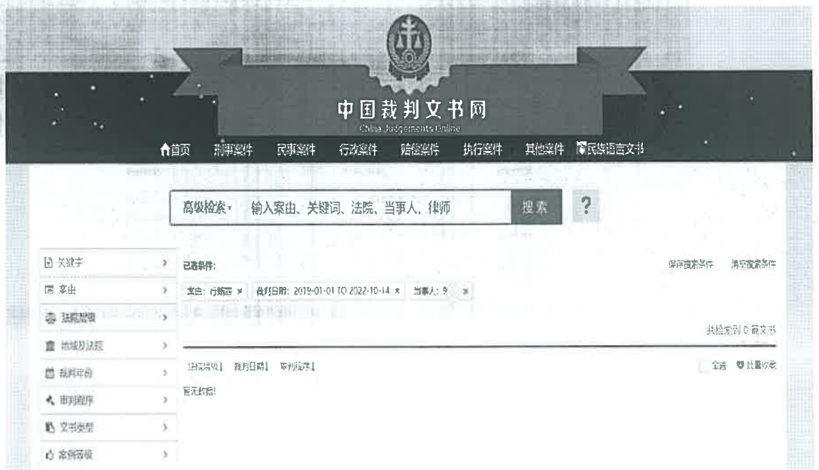
图例 4：中国裁判文书