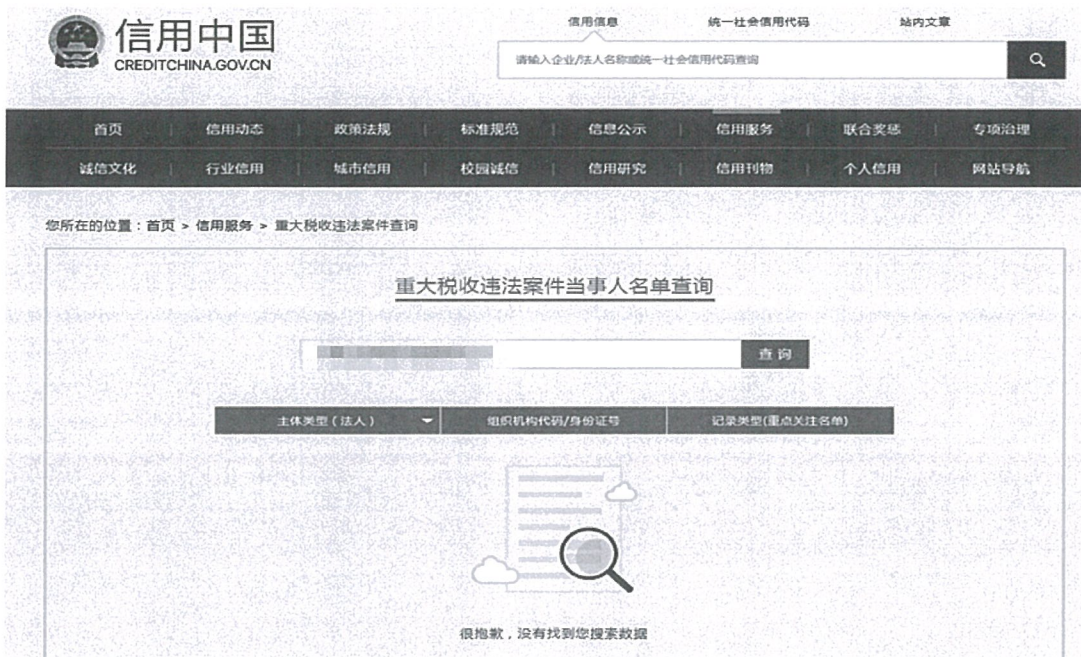
信用中国网政府采购严重违法失信行为记录名单截图