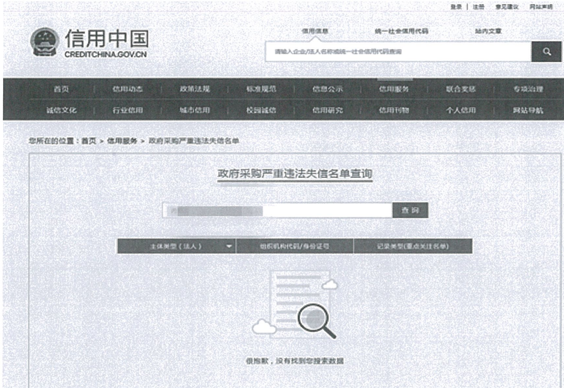
信用中国网政府采购严重违法失信行为记录名单截图