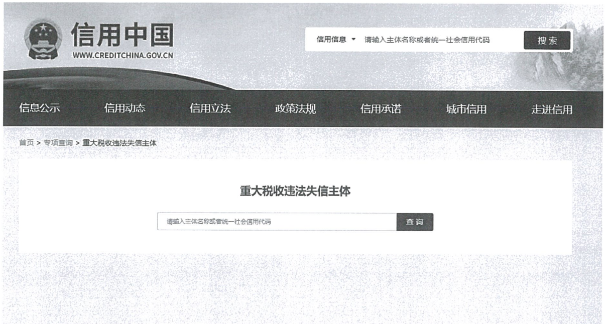
信用中国网严重失信主体名单查询记录截图